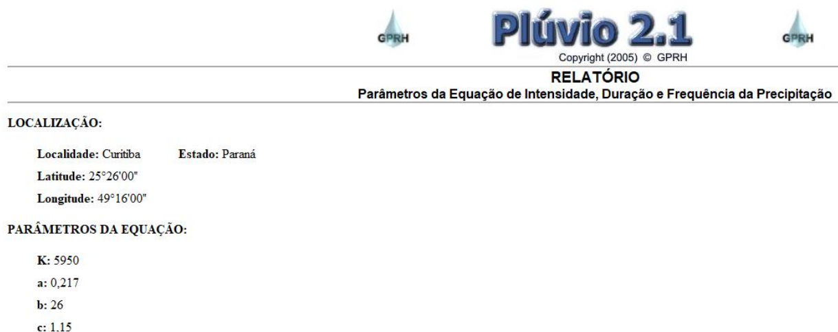
Figura 3 - Parâmetros da Equação de IDF

Com base na informação Plúvio 2.1, do Grupo de Pesquisas em Recursos Hídricos da Universidade Federal de Viçosa (UFV), determinaram-se os parâmetros da equação IDF, conforme Figura 3.